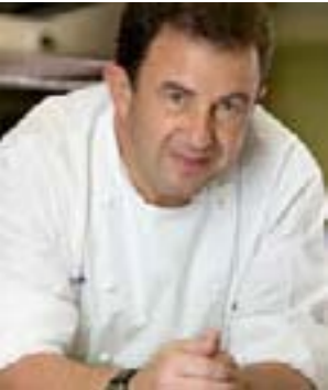
Martín Berasategui Rte. Martín Berasategui