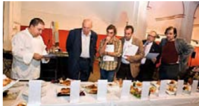
Jurado de la edición 2007. Presidente del jurado, Jordi Roca (3 estrellas Michelin).

Hoy en día, las fiestas del langostino siguen siendo la mayor atracción de Vinaròs en el mes de agosto. El acto más singular de las mismas es la popular degustación de langostinos que se realiza en el paseo marítimo de Vinaròs. En él se reparten hasta 300 kg de este manjar entre los miles de personas que se dan cita en el evento.