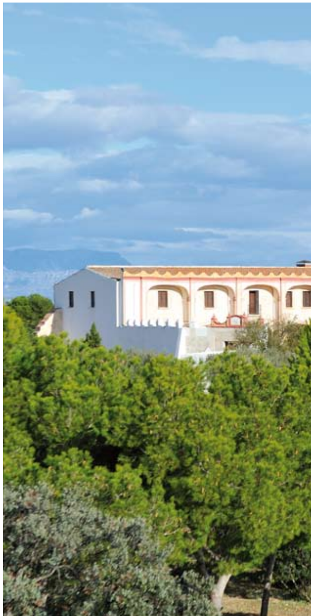
Santuario de la Misericordia

La construcción monumental más emblemática e imponente, que no debes dejar de visitar, la constituye la Iglesia Arciprestal de Nuestra Señora de la Asunción (1586), uno de los más claros ejemplos de arquitectura gótico-renacentista con portalada barroca, de imponente magnitud y flanqueada por dos elegantes columnas salomónicas. Además de por su monumentalidad, el templo resulta característico por constituir una muestra de iglesia fortificada situado en el núcleo antiguo de la población. Muestra de ello es la torre campanario, que cuenta con una altura de 33 metros y, por tanto, perfecto lugar de vigilancia y resguardo del enemigo. La construcción, la fachada de la cual fue declarada Monumento Histórico-Artístico en 1978, constituyó el principal elemento de defensa en los continuados ataques de piratas y berberiscos, ya que Vinaròs fue considerado enclave y puerto estratégico para el comercio marítimo del Mediterráneo durante los siglos pasados. Tal fue la relevancia portuaria de la ciudad que Vinaròs contó incluso con la presencia de sedes consulares de Italia y Francia, entre otros, en el momento de mayor esplendor comercial de la ciudad.