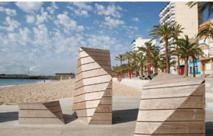
Paseo marítimo y playa del Fortí