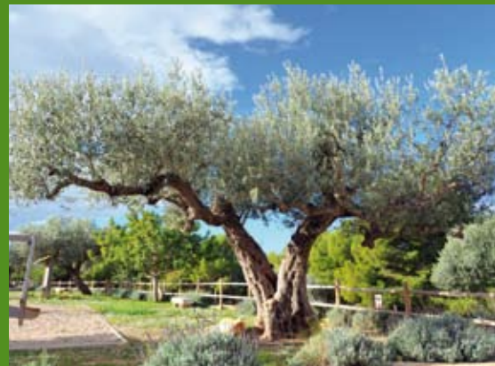
Olivo en el Santuario de la Misericordia

Para introducirte en la riqueza del medio natural, nada como recorrer los parques naturales de la Tinença de Benifassà, Sierra de l'rtà, de las Islas Columbretes y el Prat de Cabanes-Torreblanca así como descubrir el excepcional paisaje del Delta del Ebro, donde te recomendamos que visites, entre otros lugares, las lagunas de la Encanyissada.