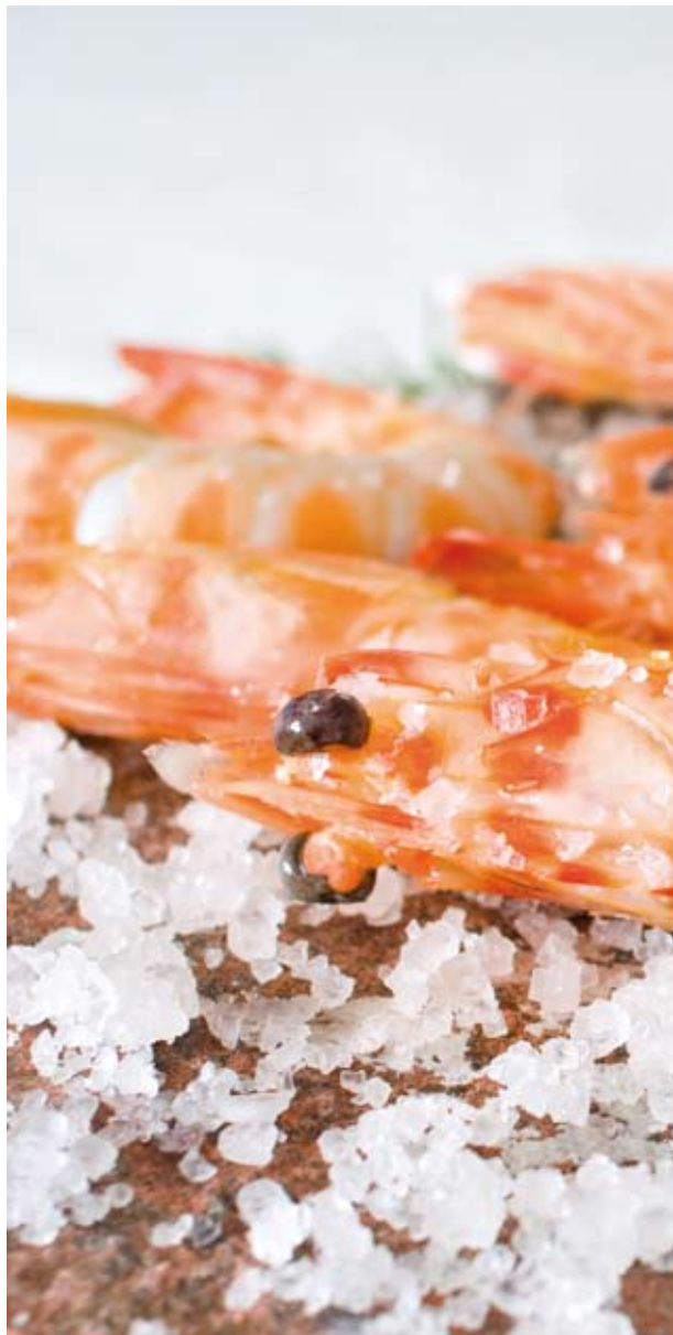
Langostinos de Vinaròs a la pedra