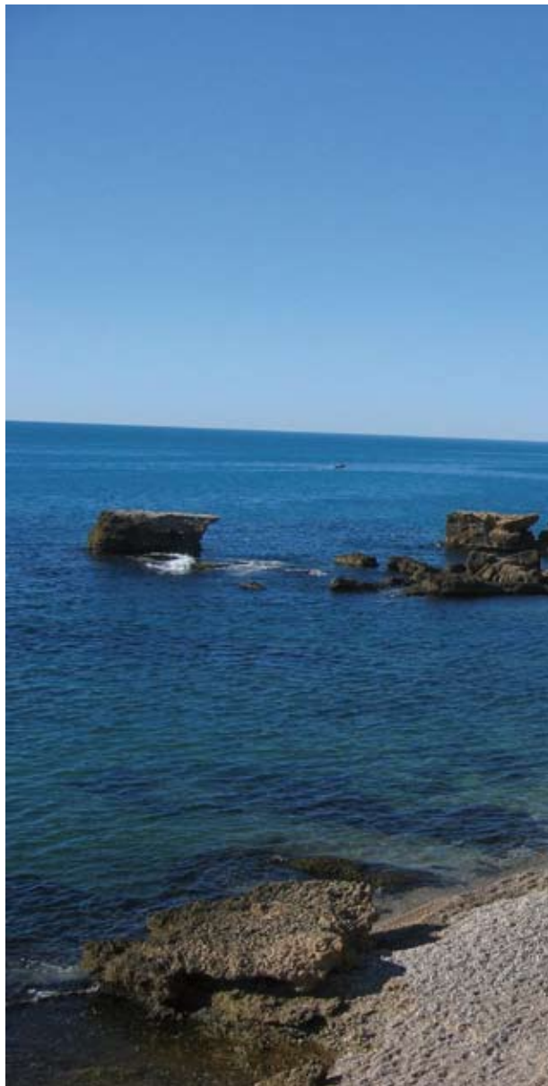
Cala de la Foradada