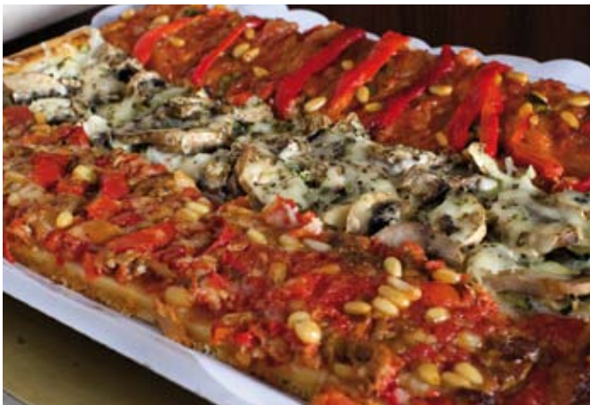
Coc de tomate, calabacín y pimiento

excelencia de la cocina vinarocense. De características distintivas y de textura y calidad que lo convierte en único en cuanto a calidad y sabor, el apreciado langostino es un gran placer gastronómico al alcance de cualquier buen gourmet. La delicadeza de su sabor se debe al suave clima del que goza Vinaròs durante todo el año así como a la baja salinidad de las aguas del litoral, enriquecidas por los sedimentos del río Ebro. Como producto de calidad valorado cada vez más en la alta gastronomía española, el langostino de Vinaròs es pescado con artes de pesca tradicionales y empleando métodos respetuosos que garantizan el equilibrio ecológico de las reservas marinas.