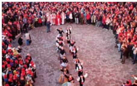
Baile local tradicional "Les Camaraes"