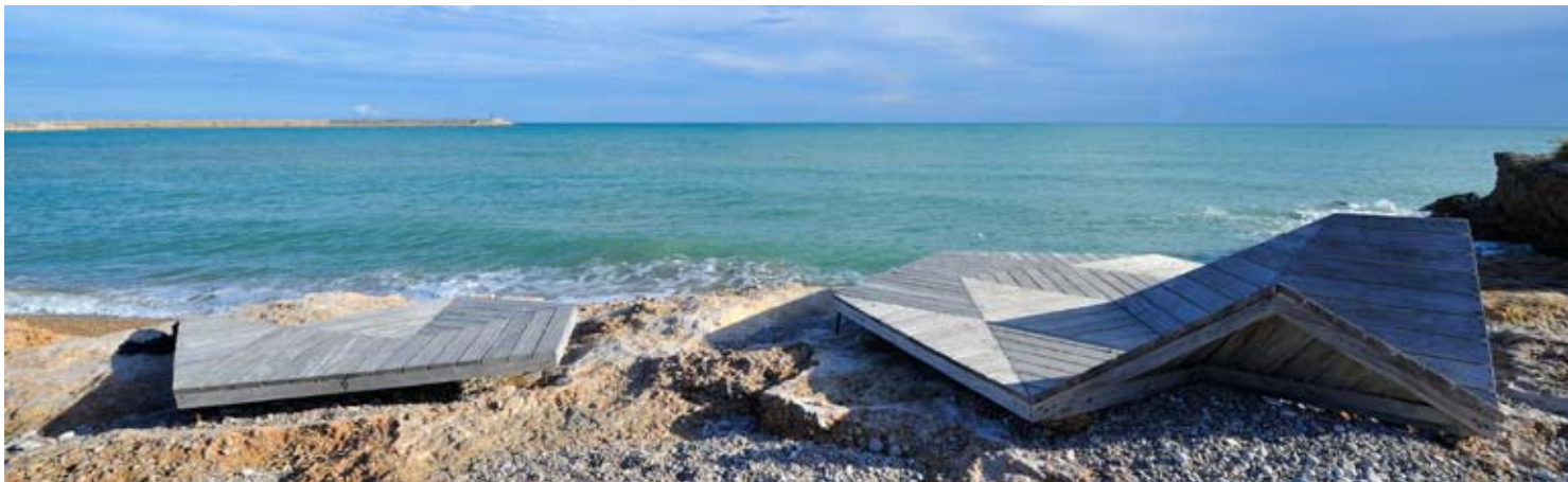
Solariums de madera en la Costa Sur

mismo entorno natural podrás encontrarlo en las otras calas conocidas como el Saldonar, Els Cossis, la Roca Plana, el Pastor, les Cales, el Triador, la Barbiguera y la playa nudista del Riu de la Sénia. Adentrándote en la zona sur, percibirás cómo resurge la belleza de calas rocosas, de formas sinuosas y atractivas y vertebradas por el paseo de Ribera, por donde podrás caminar o pedalear sobre tu bicicleta mientras respiras el aire puro del mar. Las calas de Aiguadoliva, el Puntal, les Salines, les Roques, el Fondo de Bola y els Pinets serán los espacios ideales para que disfrutes de actividades como la pesca a orillas del mar y el submarinismo, además de la tranquilidad.