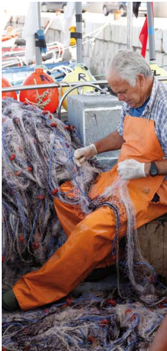
Detalle de un pescador remendando sus redes

La riqueza de verduras y hortalizas en época estival favorecen platos como las berenjenas rellenas, las empanadillas y coc de tomate y pimiento, y las patatas al caliu .