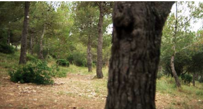
Sendero Local Redona de l'Ermita

informativos que aparecen durante todo el recorrido o bien iniciar la larga ruta hacia el norte por el sendero GR-92, llamado también Sendero del Mediterráneo.