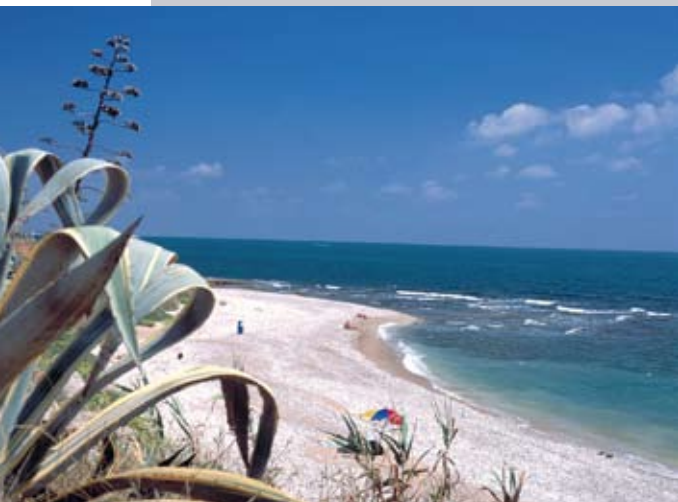
Playa de Aiguadoliva

Vinaròs te ofrece un paisaje único y bastante diferente al de otros lugares de la Comunidad Valenciana, donde calas ocultas entre rocas se combinan con amplias playas bajo un intenso color azul del cielo y del mar. En sus doce kilómetros de costa, las aguas cristalinas y de cálida temperatura te invitan al baño y a la práctica de deporte náutico y de aventura. La calidad y el respeto por el medio ambiente son las máximas en playas y calas, avaladas por la certificación ISO 14001 otorgada por AENOR y que garantiza un servicio óptimo así como las mejores condiciones medioambientales.