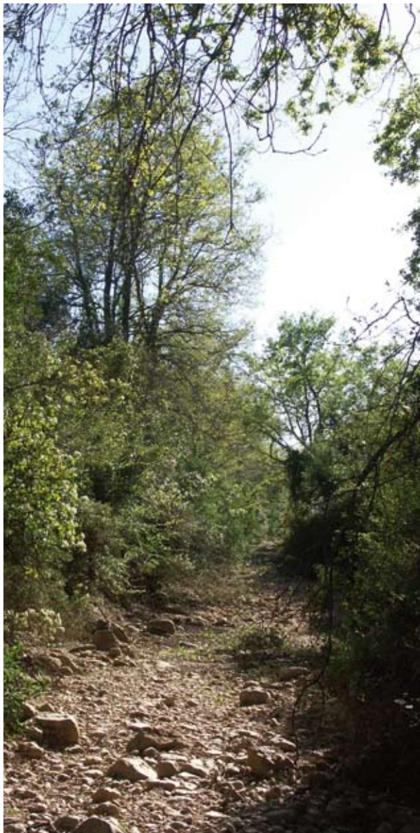
Sendero Barranc d'Aiguadoliva