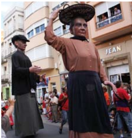
Gigantes y Cabezudos