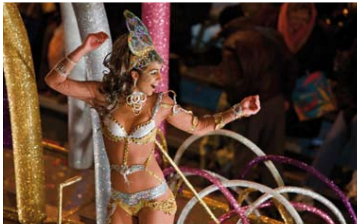
Reinas del Carnaval de Vinaròs

Una buena opción es dejarte llevar y adentrarte en estas celebraciones que seguro te sorprenderán. Coincidiendo con el día de San Antonio se encienden hogueras y es para San Sebastián (20 de enero) cuando se festeja una romería popular en honor al patrón de la ciudad. Ya llegado febrero y coincidiendo con los cuarenta días previos a la Cuaresma, la ciudad se vuelca en el Carnaval, Fiesta Declarada de Interés Turístico Autonómico que representa su más importante evento festivo. Llegada la Semana Santa, se celebran procesiones y actos religiosos centrados principalmente en los días de Jueves y Viernes Santo en los que pasos e imágenes religiosas de gran valor artístico salen de iglesias y capillas. Para celebrar la llegada del verano, niños y mayores comparten actividades y diversión en las Fiestas y Feria de San Juan y San Pedro, fiestas de carácter popular en las que disfrutamos de música al aire libre, fuegos artificiales y un gran recinto ferial para toda la familia. Durante la temporada estival se suceden las celebraciones, como la tradicional procesión marítima que tiene lugar el 16 de julio, día en el que los marineros honran a su patrona la Virgen del Carmen. Llegado el mes de agosto se celebra la Fiesta del Langostino con degustaciones de langostinos y la realización de otras actividades de ocio al