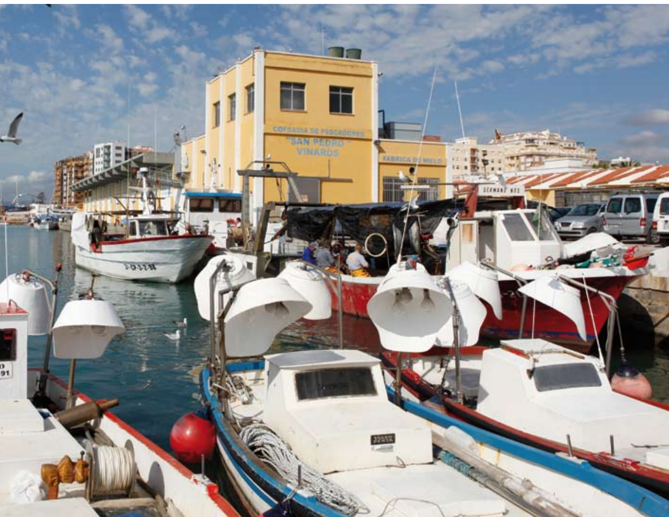
Vista panorámica del Puerto de Vinaròs