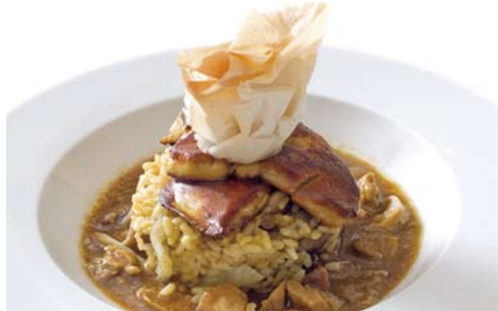
Arroz con foie y langostinos

La gastronomía es uno de los grandes atractivos de Vinaròs. Su tradición marinera unida a la riqueza de hortalizas y verduras de su agricultura aportan una amplia variedad de sabores y aromas a su mediterráneo recetario de cocina. Los arroces, pescados y mariscos, junto al langostino de Vinaròs de reconocida fama en el mundo gastronómico por su sabor y calidad, son la base culinaria de los más variados y sabrosos platos que seguro te atraparán.