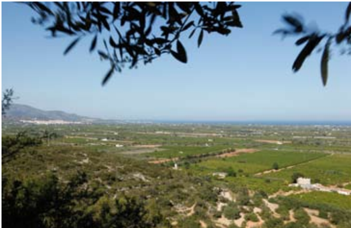
Vista panorámica desde el Santuario de la Misericordia.

en el Paseo Marítimo, que hoy en día acoge un moderno local de copas. Como referencia arquitectónica destacable del Modernismo encontrarás la Casa Sendra, de fachada simétrica que presenta