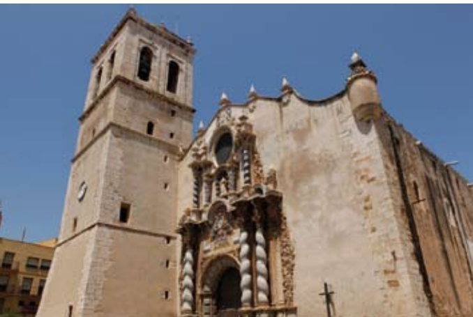
Iglesia Arciprestal de Nuestra Señora de la Asunción

La construcción monumental más emblemática e imponente, que no debes dejar de visitar, la constituye la Iglesia Arciprestal de Nuestra Señora de la Asunción (1586), uno de los más claros ejemplos de arquitectura gótico-renacentista con portalada barroca, de imponente magnitud y flanqueada por dos elegantes columnas salomónicas. Además de por su monumentalidad, el templo resulta característico por constituir una muestra de iglesia fortificada situado en el núcleo antiguo de la población. Muestra de ello es la torre campanario, que cuenta con una altura de 33 metros y, por tanto, perfecto lugar de vigilancia y resguardo del enemigo. La construcción, la fachada de la cual fue declarada Monumento Histórico-Artístico en 1978, constituyó el principal elemento de defensa en los continuados ataques de piratas y berberiscos, ya que Vinaròs fue considerado enclave y puerto estratégico para el comercio marítimo del Mediterráneo durante los siglos pasados. Tal fue la relevancia portuaria de la ciudad que Vinaròs contó incluso con la presencia de sedes consulares de Italia y Francia, entre otros, en el momento de mayor esplendor comercial de la ciudad.