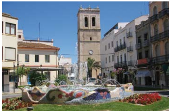
Vista panorámica desde la Plaça de Jovellar

Viaja en el tiempo y descubre la cultura e historia de Vinaròs a través de un itinerario turístico audioguiado, que cuenta con narraciones adaptadas al recorrido para niños y adultos. En un agradable paseo de cerca de dos horas, podrás recorrer diez puntos diferentes del término municipal de Vinaròs, que también podrás visitar e interpretar con la ayuda de los paneles informativos que complementan al recorrido histórico-artístico. Acércate a la Oficina de Turismo y disfruta del servicio de audioguías tematizadas en formato MP3. Además, puedes descargar toda la información de forma gratuita y libre desde la web: www.audioguiasvinaros.com .