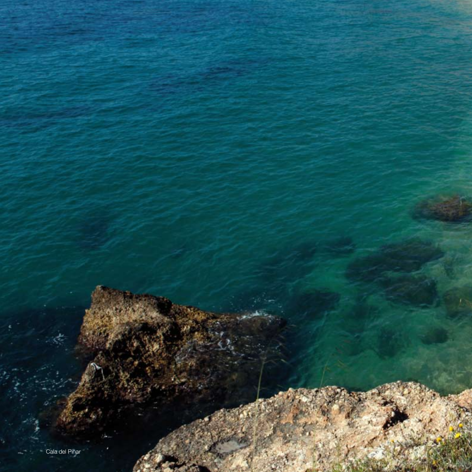
Cala del Pinar