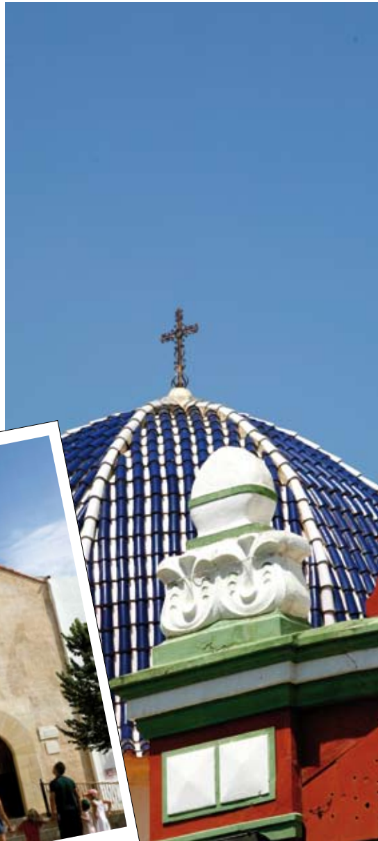
Cimborrio del Auditorio municipal y el Mercado

el Santuario de la Misericordia es un lugar precioso... y vaya vistas panorámicas!