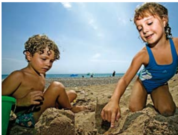
por la mañana solemos ir a la Cala del Pinar, el agua está limpiísima.

Las playas del Fortí y Fora del Forat, paralelas al paseo marítimo, y la playa del Clot, transcurren junto al centro urbano, conectando desde el puerto hasta el río Cervol. Amplias y de fácil acceso, suponen el mayor centro de atracción turística y disponen de una variada oferta de servicios y actividades lúdico-deportivas para todos los públicos. Recorriendo la costa norte encontrarás un entorno natural singular, conformado por un conjunto de calas y playas protegidas por pequeños acantilados. Acércate hasta las playas y calas de Sòl de Riu, les Deveses, les Timbes, les Llanetes, la Foradada o el Pinar y conoce la vegetación mediterránea formada por el palmito y romero marino. Este