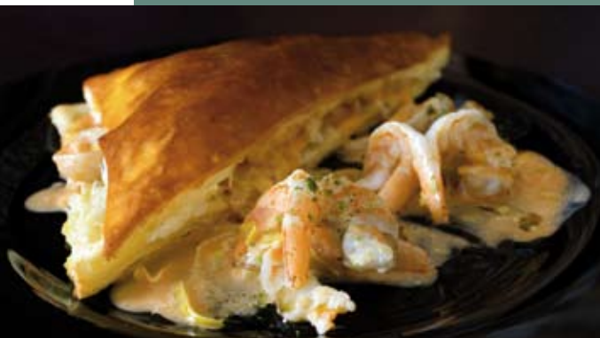
Pastel de hojaldre relleno de langostino de Vinaròs