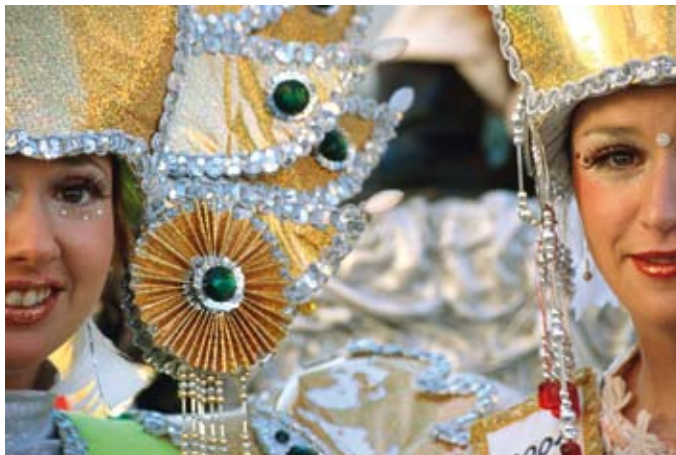
Desfile de las comparsas

aire libre como cine de verano, ciclo de conciertos, espectáculos y verbenas... Las propuestas culinarias tienen su continuidad con otros eventos como las Jornadas de Cocina Aplicadas al Langostino, en julio, o la celebración del Mes de los Arrozces en noviembre. Como preludeo al otoño, durante el mes de septiembre, se conmemora el Otorgamiento de la Carta Puebla a la Ciudad de Vinaròs, organizando para ello múltiples actividades culturales como conciertos, exposiciones, teatro y visitas guiadas, entre otras. Y ya entrada la época invernal, Vinaròs engalana sus principales calles y organiza actividades como talleres infantiles, teatro, el Belén viviente, o la Cabalgata de Reyes para disfrutar de la época navideña.